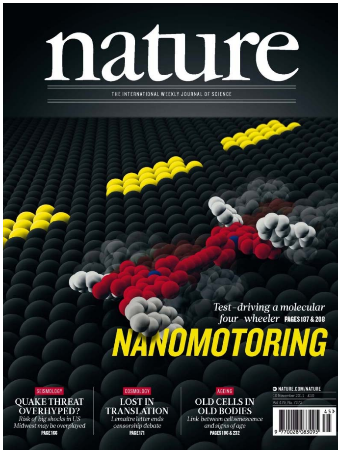
«Nature»-Titelblatt der Ausgabe vom 10. November 2011 mit dem wohl «kleinsten Elektromobil der Welt»