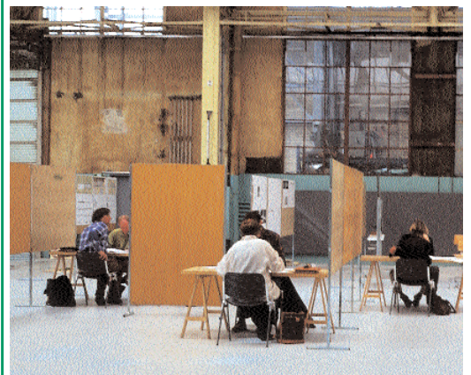
Ausbildung von Studenten

Erstausbildung und Weiterbildung stehen bei den Fachhochschulen nach wie vor im Vordergrund. Von besonderer Bedeutung sind Nachdiplomkurse für die Ausbildung von Energiespezialisten und Bauökologen. Forschung, Entwicklung und Praxisnähe sind die Voraussetzung für die kompetente, praxisorientierte Weiterbildung. Die Zusammenarbeit mit der Eidg. Materialprüfungs- und Forschungsanstalt ergänzt die Möglichkeiten der Fachhochschulen.