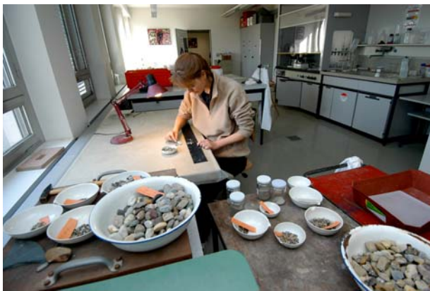
Photo 2: Les granulats préparés à partir de déchets de chantier sont examinés en vue de leur utilisation pour la confection de béton.