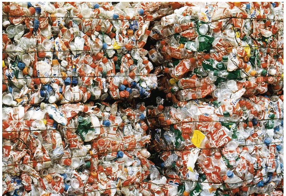
Immer mehr gebrauchte Kunststoffprodukte werden gesammelt und recycelt (Bild: PET-Flaschen)

Neben dem durch die Nutzung des Produktes entstandenen Alterungs-Zustand spielt beim Kunststoffrecycling die Reinheit des Altstoffes eine massgebende Rolle: Verunreinigungen (Rückstände des Füllgutes, Papieretiketten, etc.) vermindern in der Regel die Altstoffqualität. Zusätzlich wird das Material durch die wiederholte Verarbeitung thermisch strapaziert. An der EMPA St. Gallen kann der Recyclingprozess im Labor-massstab nachvollzogen werden: Dieser Prozess beinhaltet das Zerkleinern, Waschen, Mischen, Granulieren mit anschliessender Mehrfach-Verarbeitung des Materials mit Extrusion oder Spritzguss. Dabei können auch gezielt Zusatzstoffe wie Stabilisatoren oder Modellsubstanzen zudosiert werden. Die Prüfmuster werden sowohl mit Hilfe analytischer Methoden (z.B. Bestimmung der molekularen Strukturveränderungen) als auch mit anwendungsorientierten Prüfungen (z.B. Verschweissbarkeit von Polyethylen) untersucht. Auf diese Weise lassen sich die Einflüsse von Zusätzen und die thermische Schädigung der Kunststoffmatrix infolge Mehrfachverarbeitung studieren.